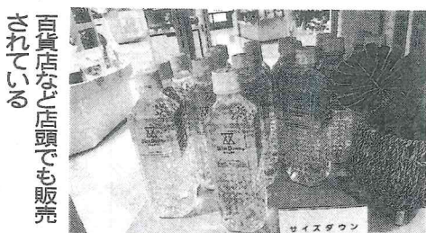
百貨店など店頭でも販売されている

社長)と話す。採水地は富士山付近なので、バナシウムやシリカといった希少なミネラルも含まれているという。価格やデザインなどは現行品のまま展開する。アットコスメで1位を獲得したことについては「バージョンアップ部門での1位は予想していなかった。驚いている。製品が一般の愛用者からも高い支持を受けている証左だ(同)とし、この強力な追い風もあり、NB市場でも今後の流通がさらに加速していくと予測される。